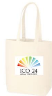
コンgresバッグイメージ

◎申込方法・締切：参加ご希望がございましたら、添付の申込書にご記入のうえ下記の申し込み先までお送りください。ただし、数に限りのあるものは、先着順とさせていただきます。